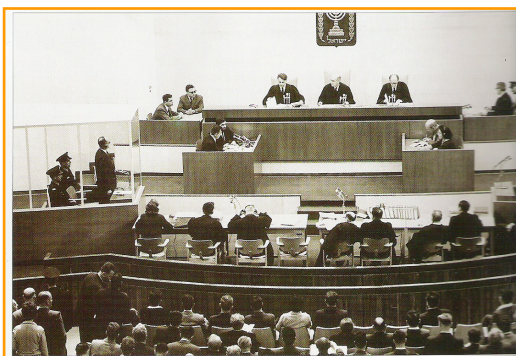
Le tribunal de Jérusalem bondé durant le procès Eichmann.

Le procès Eichmann réveilla la conscience de la communauté internationale et révéla au monde entier l'ampleur des atrocités nazies. Il permit aux survivants de la Shoah d'exprimer leurs souffrances et d'en parler pour la première fois.