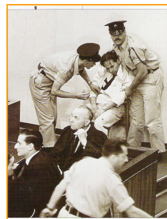
L'écrivain K. Zetnik s'évanouit au banc des témoins.