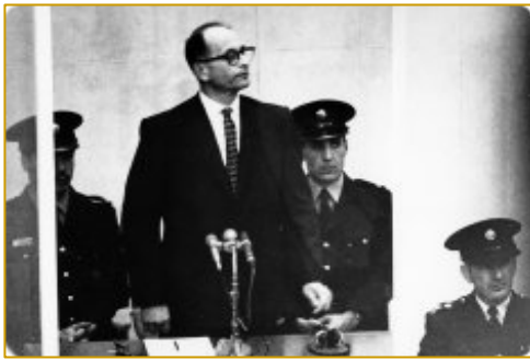
Eichmann témoigne à l'abri d'un box protégé par une vitre à l'épreuve des balles.