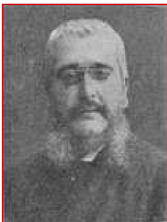
Francis de Préssensé.

Il est enfin l'instigateur du Pacte Briand-Kellogg (1928) pour le renoncement à la guerre.