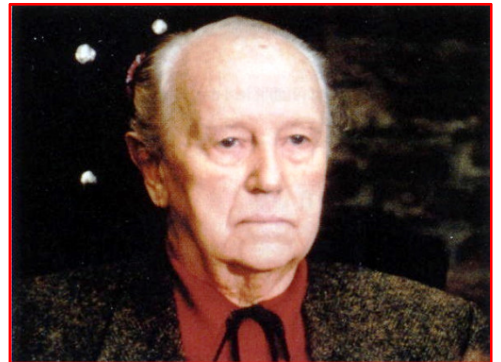
Paul Touvier, jugé 1994

Touvier infiltre la Résistance, interroge des prisonniers, dirige des rafles, pille des biens juifs et riposte à l'assassinat de Philippe Henriot en faisant fusiller sept juifs à Rillieux-la-Pape, le 29 juin 1944. Il fréquente des prêtres collaborateurs.