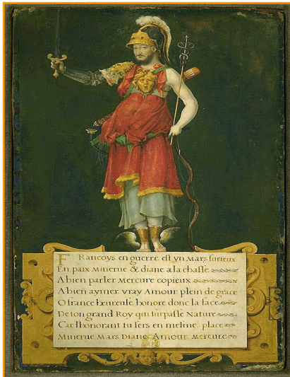
François Ier en déité, vers 1545.