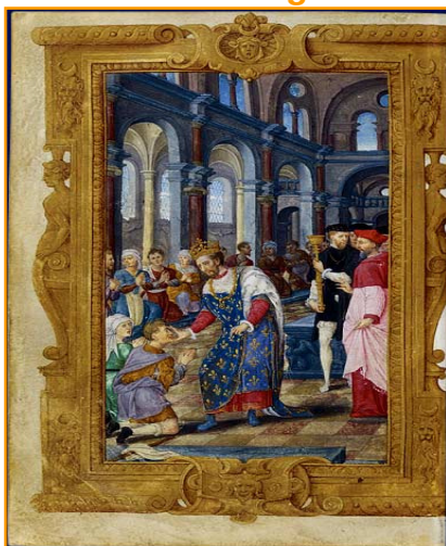
La guérison des écrouelles, extrait des Heures du roi Henri II, (BnF).

Au milieu du XIIe siècle, le pouvoir de guérir devient héréditaire dans la lignée royale. Le roi soigne les écrouelles, une pathologie psychosomatique liée à une mauvaise hygiène et susceptible de brutales rémissions.