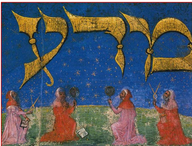
Cette enluminure du Mishneh Torah de Maïmonide (1138-1204) évoque les lois permettant de fixer la date de la nouvelle lune et de calculer le calendrier lunaire. Le rabbin, médecin et philosophe de Cordoue s'est inspiré, notamment dans la première partie de son Code, des travaux d'Aristote. (Vatican, bib Apos., cod rossiana 498, 13v, Maimonide Mishneh Torah, Italie, 15 ème siècle)