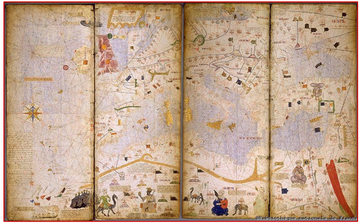
Ce portulan (carte marine indiquant la position des ports et le contour des côtes) occupe deux feuillets de l'Atlas catalan, un ouvrage attribué à Abraham Crescas (1325-1387), « Magister mappamundorum et bruxolarum » à la cour du roi d'Aragon.

La famille Crescas (ou Cresques) est établie à Majorque pendant plusieurs générations : elle compte des savants, hauts-fonctionnaires, ainsi que deux cartographes célèbres : Abraham, l'un des chefs de file de l'école cartographique majorquine (auquel le roi d'Aragon commande une carte du monde destinée au jeune Charles VI) ; puis son fils Yehuda. Ce dernier, converti au christianisme en 1391 comme beaucoup de juifs majorquins, prend le nom de Jaume Ribá Jacobus Ribes et devient "Magister cartorum navigandi" à la Cour.