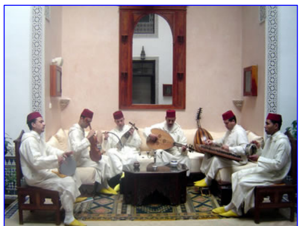
La formation arabo-andalouse Quraysh de Fès

Une nouba (suite musicale et vocale), du fait de sa longueur, n'est que très rarement jouée dans son intégralité. Par conséquent, c'est le chef qui effectue le choix et l'agencement harmonieux des différentes parties.