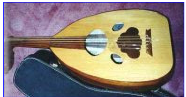
Le 'ûd a un rôle harmonique et mélodique

Le 'ûd possède une double fonction d'accompagnement et de soliste, un double rôle harmonique et mélodique.