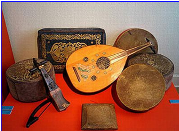
L'oud et le rabâb, les principaux instruments de la musique andalouse marocaine