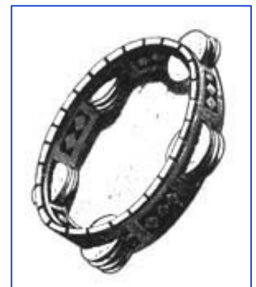
Le joueur de târ maintient le tempo

Chaque noubas est construite en cinq mouvements appelés mizân comportant chacun un rythme de base et suivant un principe d'accélération progressive : Mizân Basît - Mizân Qâ im wa-nisf - Mizân Btâyhî - Mizân Darj - Mizân Quddam.