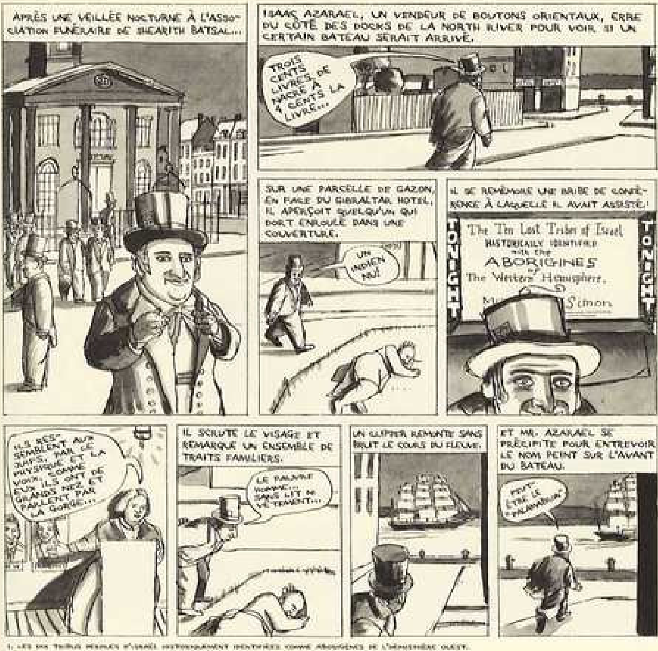
1. LES DIX TRIBUS PERDUES D'ISRAËL HISTORIQUEMENT IDENTIFIÉES COMME ABORIGÈNES DE L'AMÉRIQUE OUEST.