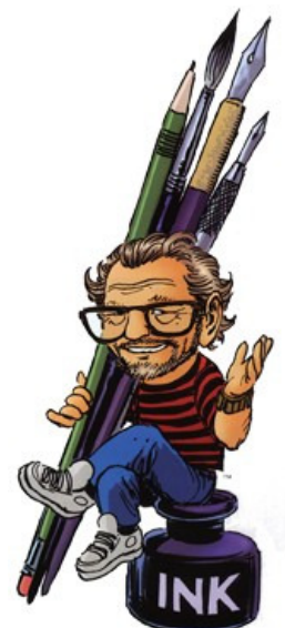
Caricature de Joe Kubert, armé de ses crayons...