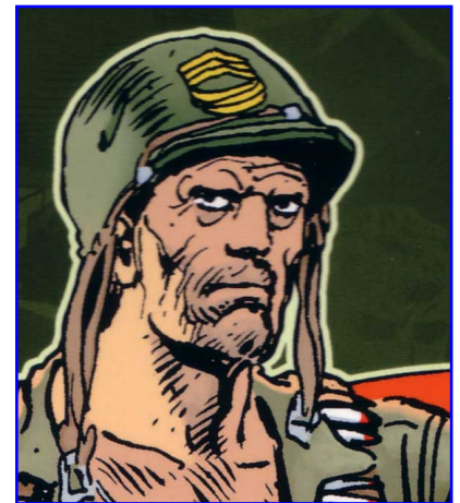
Sergent Rock, un héros viril

Enemy Ace est un pilote d'avion allemand de la première guerre mondiale, personnage créé en 1965 également avec Kanigher.