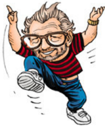
Caricature de Joe Kubert sur son site personnel