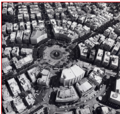
La place Dizengoff. Meir Dizengoff fut le premier maire de Tel-Aviv (1921-25 ; 1928-36).