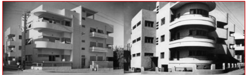
Tel-Aviv abrite la plus grande concentration au monde de bâtiments Bauhaus.