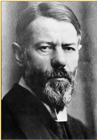
Le sociologue Max Weber