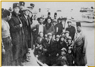
Quatrième vague d'aliya.