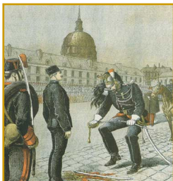
Dégradation du capitaine Dreyfus.

Arrivée d'une grande vague d' aliya en provenance de Russie.