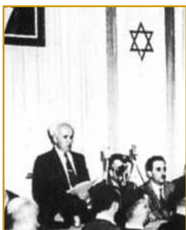
Proclamation d'indépendance de l'Etat d'Israël.