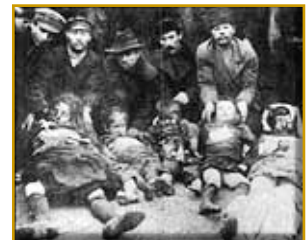
Pogrom de Kichinev.

Mort de Théodore Herzl à Vienne. La Seconde aliya est précipitée par les grands pogroms de 1902 et 1903. Création du Va'ad Halashon (Comité de la langue hébraïque).