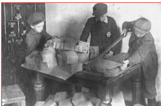
Des enfants juifs fabriquent des boîtes au ghetto de Glubokoye.