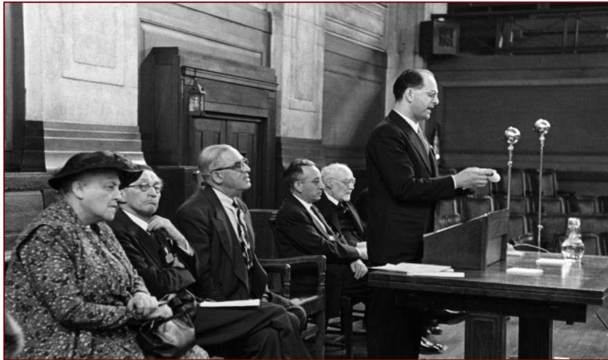
Le rabbin Zaoui, à la tribune, avec Lily Montagu à l'extrême gauche de la photo et Léo Beck à l'extrême droite.

Le 26 août 2009, le rabbin André Zaoui s'est éteint à Jérusalem à l'âge de 93 ans.