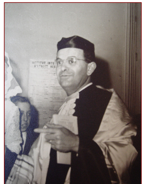
André Zaoui lors d'une conférence de la World Union for Progressive Judaism