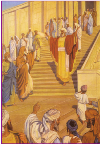
Le Grand-Prêtre lors de la fin du service de Yom Kippour