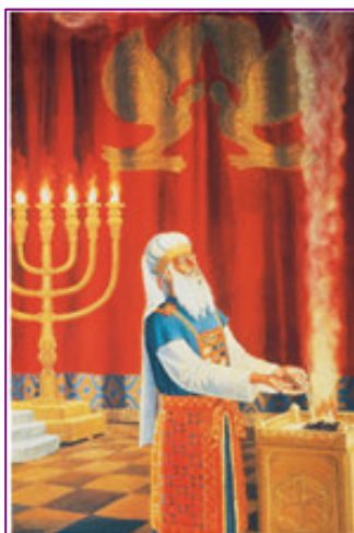
Le Grand-Prêtre portant sa tenue traditionnelle complète.