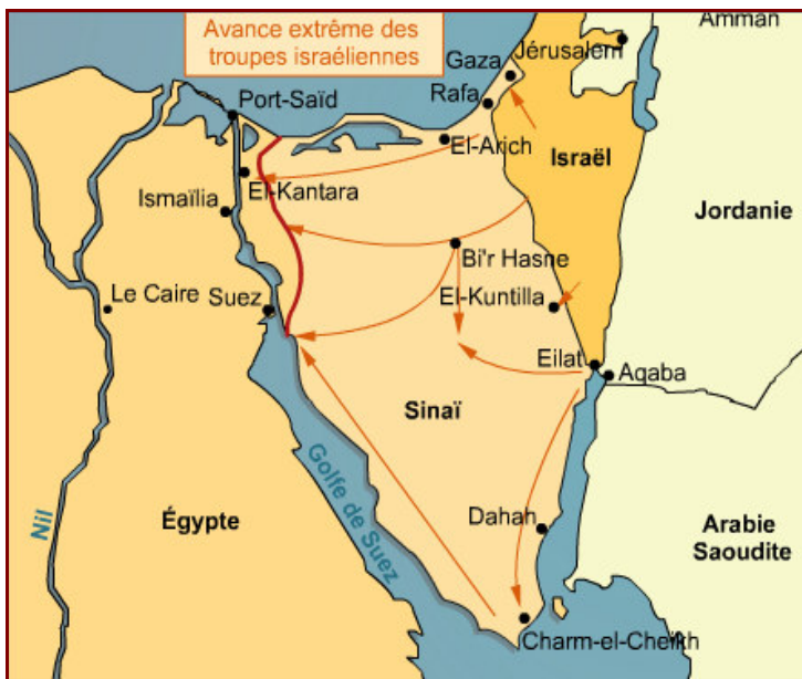
Carte de l'avancée maximale des troupes israéliennes dans le Sinaï lors de la guerre