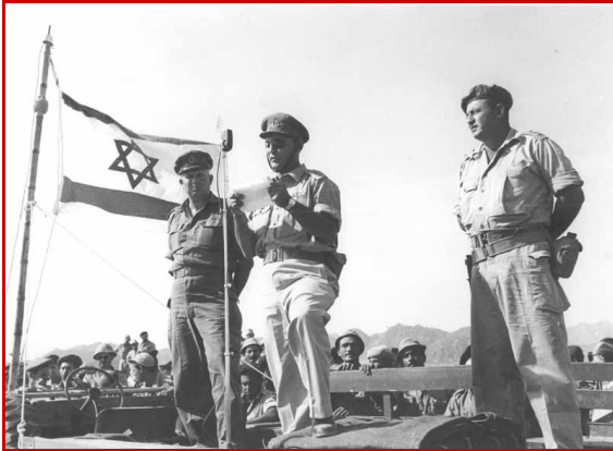
Moshé Dayan, chef de l'état-major de Tsahal, tient le discours de la victoire à Sharm el-Sheikh (Sinaï). Novembre 1956.