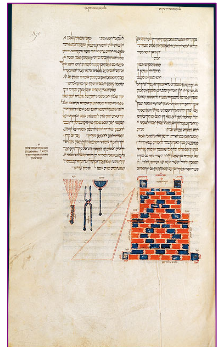
Moïse Maïmonide, Mishneh Torah (Catalogne, vers 1370, Parchemin)