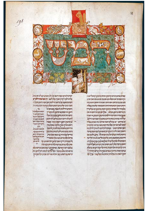
L'étude du Livre : une passion (Abrégé du Talmud d'Asher ben Jehiel, Milan], vers 1480, Parchemin)