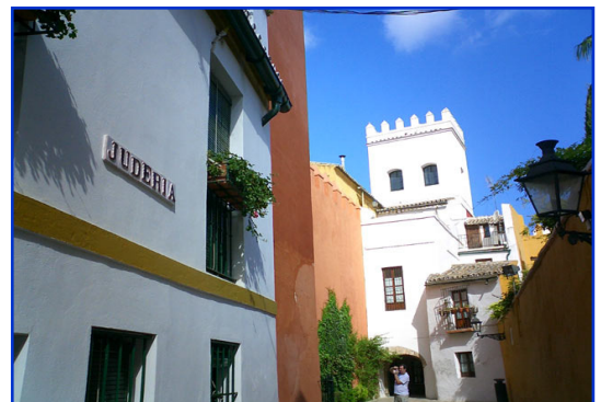
Une rue dans le quartier juif de Séville.

Rabbi Isaac bar Chechet Perfet (1326-1408) et rabbi Simon ben Tsemah Duran (1361-1444) comptent parmi les personnalités les plus célèbres de cette vague de réfugiés qui s'implantent à Alger et en territoire ziyanide (dynastie, 1235-1393).