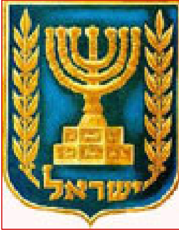
La Menorah est l'emblème officiel de l'Etat d'Israël.