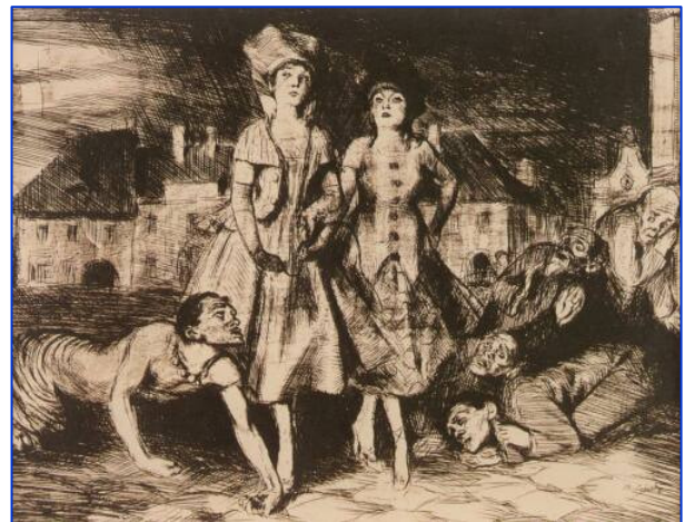
Bruno Schulz, Révolution dans la ville , du Livre de l'idolâtrie, cliché sur verre, 1921, Musée national, Cracovie

Bruno Schulz, Correspondance et essais critiques , Denoël, Paris, 1991.