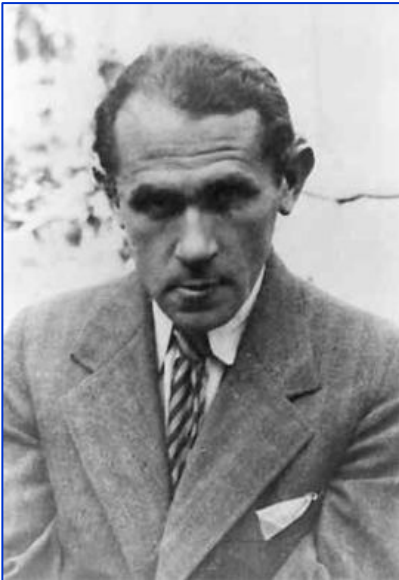
Bruno Schulz en 1932