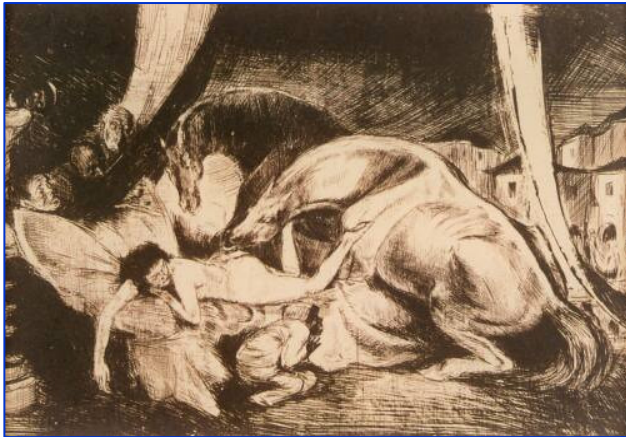
Bruno Schulz, eunuques et étalons II , 1921, cliché verre, Musée National de Cracovie

L'œuvre littéraire de Bruno Schulz est relativement modeste en quantité : il s'agit de deux recueils de nouvelles, Sklepy cynamonowe ( Les boutiques de cannelle ) et Sanatorium pod Klepsydrą ( Le sanatorium au croque-mort ), ainsi que de quelques ouvrages que l'auteur n'inclut pas aux premières éditions de ces recueils. Il existe également une correspondance, Księżdz listów ( Correspondance ) qui fut publiée à titre posthume, ainsi que les essais critiques qu'il publia dans la presse. Bruno Schulz parle le yiddish et l'allemand, mais c'est en polonais qu'il publie ses livres.