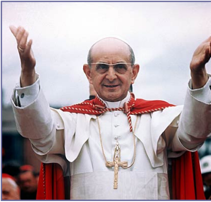
Paul VI (1897 -1978) – mandat : 1963-1978