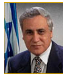
MOSHE KATSAV (2000- ) , action sociale et homme politique