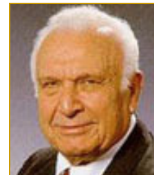
EPHRAIM KATZIR (1973-78) , biochimiste de renom