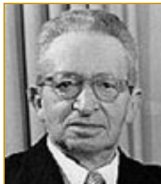
ITZHAK BEN-ZVI (1952-63) , chef de l'Agence juive et historien