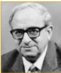
YITZHAK NAVON (1978-83) , homme politique, éducateur et écrivain