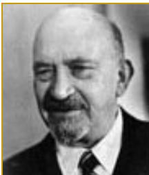
CHAIM WEIZMANN (1949-52) , dirigeant sioniste et éminent savant