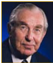
CHAIM HERZOG (1983-93) , juriste, général, diplomate et écrivain