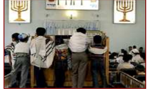
Jour de Shabbat à la synagogue de Shiraz

• Les juifs iraniens avaient obtenu l'égalité des droits dans la Constitution de 1906 et l'opposition aux juifs n'était pas violente. Ils avaient le droit d'élire un député à l'assemblée nationale ( Majlis ) mais étaient peu présents dans les fonctions publiques.