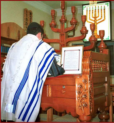
Un juif d'Iran en train de prier dans une synagogue de Shiraz en 1999