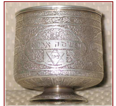
Un verre de kiddouch issu d'une collection iranienne

• De même, la tombe du prophète juif Daniel se trouve à Soussa (près de la frontière actuelle de l'Iran avec l'Iraq). Hamadhan est également célèbre pour la tombe d'Esther et Mordechai, et la synagogue est un important lieu de pèlerinage pour la vieille communauté des juifs d'Iran.