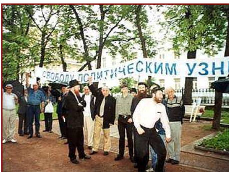
Des juifs de Moscou manifestant pour la libération des 13 juifs iraniens

En janvier 1999, 13 juifs sont arrêtés et retenus en otage en Iran sous prétexte d'espionnage pour Israël et les USA. Parmi eux : un adolescent de 16 ans, des responsables religieux, un rabbin... Ils risquaient d'être pendus à l'issue d'un procès à huis-clos à Shiraz au sud de l'Iran simplement parce qu'ils sont juifs, et donc membre d'une communauté très minoritaire dans la République Islamique. Le 1er juillet 2000, l'Iran condamne 10 des 13 accusés à des peines de prison de 4 à 13 ans. Les peines sont réduites le 21 septembre 2000. Le nouvel appel est rejeté le 7 février 2001. Enfin, le 20 février 2003, l'Iran confirme la libération de tous les détenus juifs.