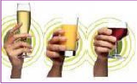
Pourim : fête de l'inversion des valeurs.