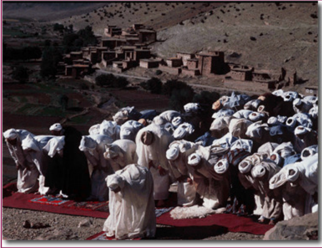
Pendant les deux premières années de son activité, Mahomet priait en direction de Jérusalem.