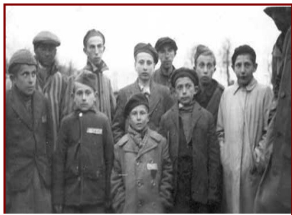
Groupe d'enfants de Buchenwald