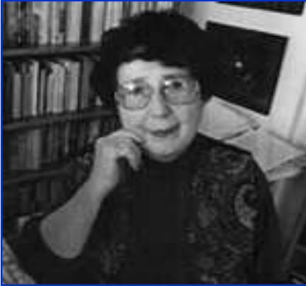
Emmy Werner, la « mère » de la résilience