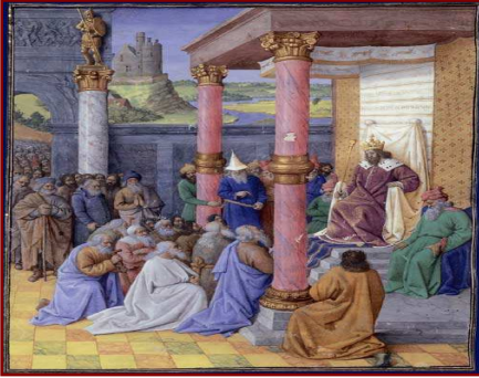
Cyrus le Grand et les Hébreux