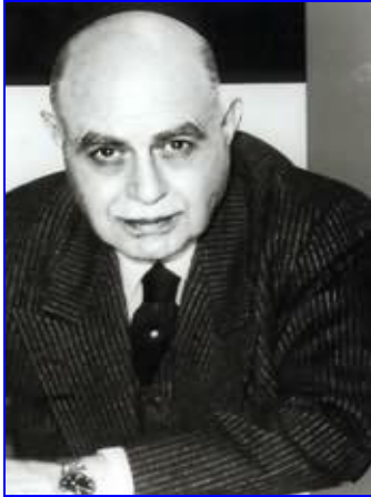
Albert Cohen (1895-1981)