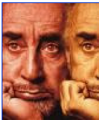
Source : couverture du livre Pseudo de Romain Gary, Folio Gallimard, 2004.