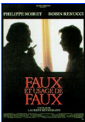
Affiche du film Faux et usage de faux , de Laurent Heynemann (1990), sur l'affaire Ajar.