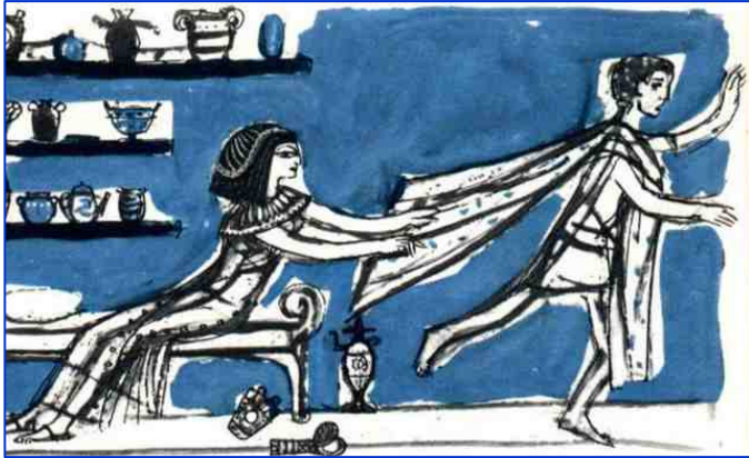
Joseph et la femme de Putiphar, La bible racontée aux enfants, Anne de Vries, 1964