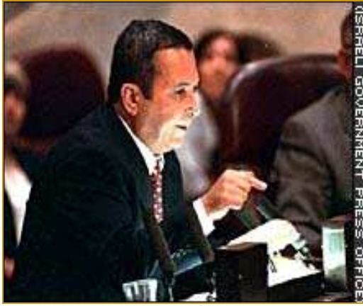
Ehud Barak s'adressant à la Knesset