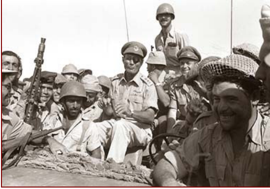
Moshé Dayan, chef de l'état-major de Tsahal, porté par ses troupes victorieuses au Sinaï le 6 novembre 1956.