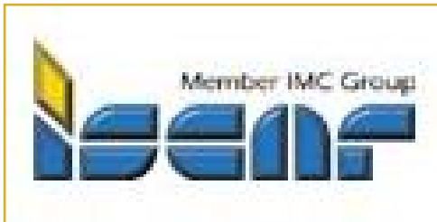
La plus grande transaction jamais réalisée en Israël.

Installé dans le parc industriel de Tefen, en Galilée, Iscar est la seconde entreprise mondiale de machinerie métallique. Ce qui au départ a été créé par Stef Weirtheimer comme un simple magasin à Nahariya est devenu en 50 ans une entreprise d'envergure mondiale, employant 5 000 personnes (2 000 en Israël), générant un chiffre d'affaire d'un milliard de dollars environ, avec un taux de croissance annuel de l'ordre de 15% et investissant 10% de son chiffre d'affaire dans la recherche et le développement.