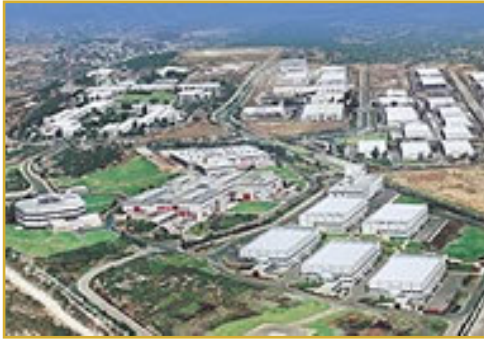
L'entreprise Iscar, un simple magasin à ses débuts.