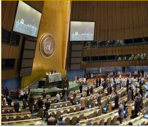
Session d'urgence de l'ONU à propos d'Israël, 17 novembre 2006