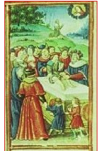
Détail : Ismaël est circoncis par son père. Un personnage porte le chapeau caricatural des juifs. Autre représentation typiquement chrétienne : en arrière-plan, Abraham apparaît en dialogue direct avec Dieu. Manuscrit de Besançon, XV°s.