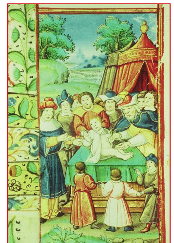
Détail : Isaac circoncis par son père. L'artiste montre bien la différence d'âge entre le fils de Sarah et Ismaël, ci-dessus. Manuscrit de Besançon, XV°s.