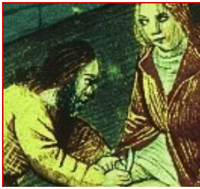
Les chrétiens évoquent la circoncision d'Isaac, même s'ils ont eux-mêmes renoncé à ce rituel.

Après avoir quitté sa ville d'Ur en Chaldée, Abraham donne une nouvelle preuve de son obéissance à Dieu : il pratique la circoncision sur lui-même, puis sur ses fils, et engage l'ensemble de sa descendance à pratiquer le même rituel. La circoncision devient ainsi le signe charnel de l'Alliance entre Dieu et son peuple.