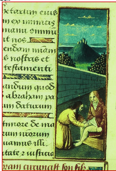
Abraham circoncit Ismaël. Cette image est typiquement chrétienne : les manuscrits juifs ne représentent pas le fils d'Agar, associé à l'Islam, à côté des autres figures d'Israël. Manuscrit latin, XV°s. (vers 1480)