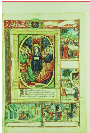
Cette frise illustre les différents épisodes de la vie d'Abraham, en particulier la circoncision de ses deux fils. Ce rituel n'est pas pratiqué par les chrétiens, mais il se retrouve dans l'Islam comme dans le judaïsme. (Voir détails ci-contre.) Livre d'heures, Besançon, XV°s.