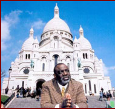
Cheik Doukouré, réalisateur, membre de l'amitié judéo-noire