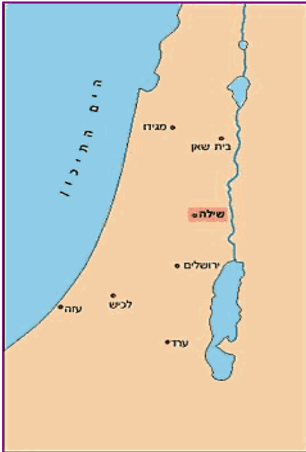
La ville de Shilo; ici en gras, au nord de Jérusalem.