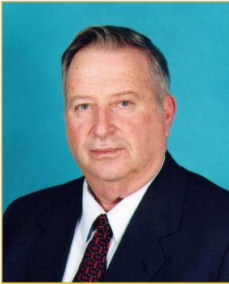
Avraham Shohat, ancien ministre de l'Economie (1992-1996 et 1999-2001).