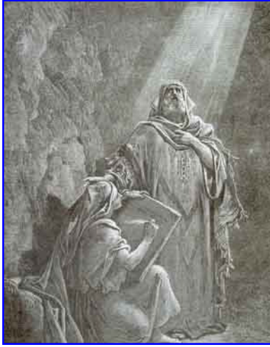
Le prophète Jérémie, Gustave Doré