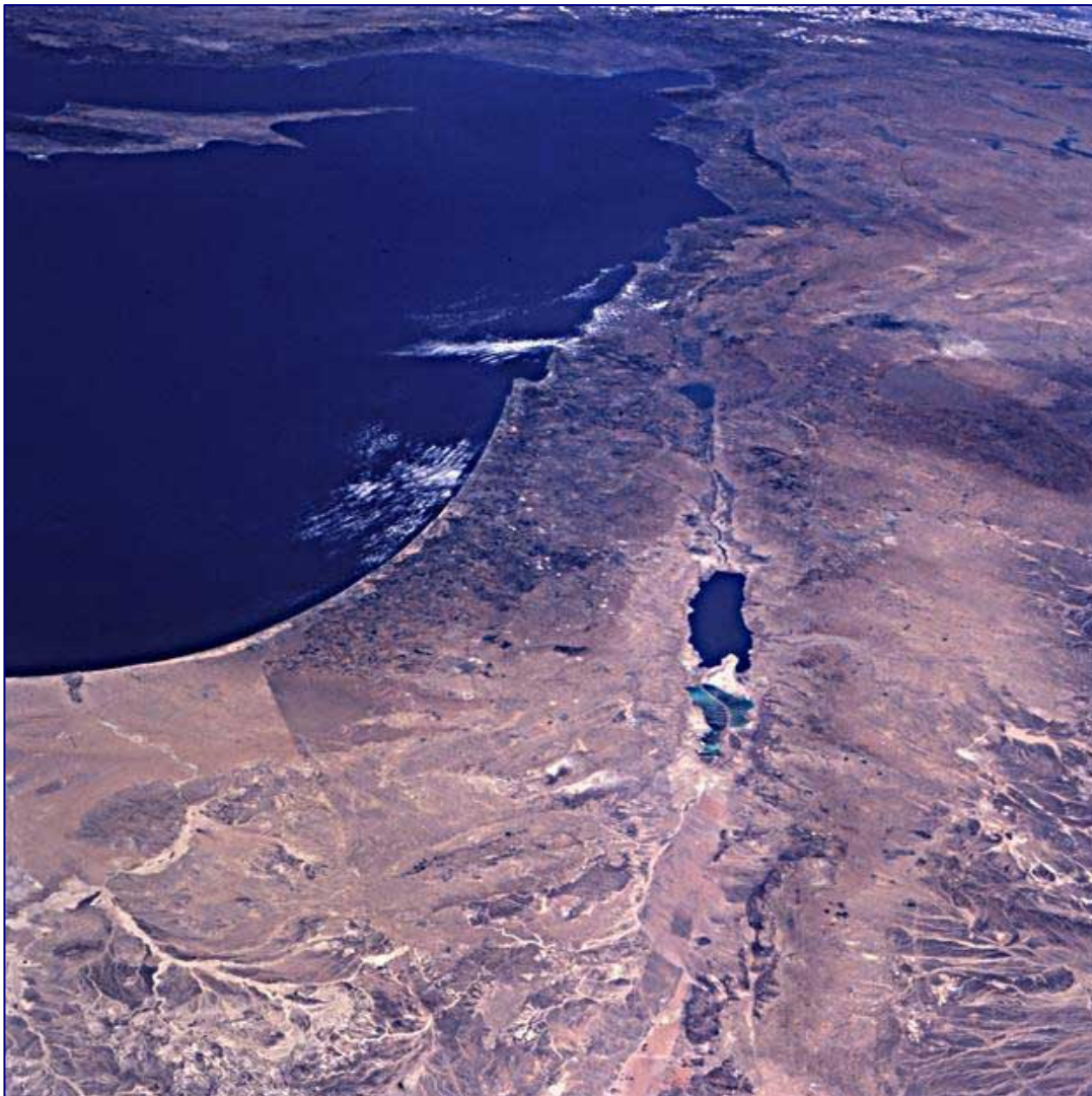
Photo satellite du territoire israélien et des pays frontaliers : l'Egypte, la Jordanie, la Syrie et le Liban. La zone urbanisée (plus foncée) dessine clairement les limites de peuplement.

Sources : Office Central des Statistiques - www.cbs.gov.il Israel Science and Technology Homepage - www.science.co.il