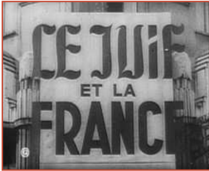
Capture d'écran des informations du 12 septembre 1941. Une intense campagne est menée pour inciter le grand public à visiter l'exposition au Palais Berlitz.