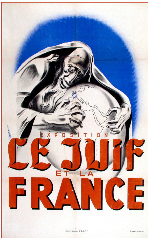
La plus répandue des affiches pour l'exposition. Plusieurs formats de l'affiche existent, selon les lieux où elles ont été posées..