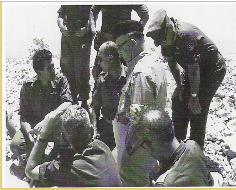
10 juin 1967 : sur les hauteurs du Golan, le Premier ministre Eshkol, Moshé Dayan et David Elazar